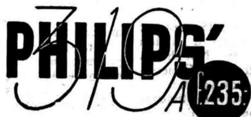
BOEAT GELIJK-DAN WISSELSTROOM MODEL 319 U

Terlaoe banjak oentoek diseboet satoe persatoenja adalah perbaiki baroe yang dipakaikan didalam Philips 319 A! Penerimaan soeara tetap, sentausa dan njata tersebut net-spinnigsstabilisator. Soeara diperbaiki. Dengar ini toestel yang akan mengasih penerimaaan soeara menjenangkan. Oentoek Gelijk- dan wisselstroom type 319 U.